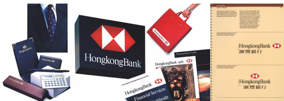
【滙豐銀行 視覺識別系統 1983-84】

( 石漢瑞先生以六角形令滙豐銀行的品牌標誌更為現代化及國際化，令它在金融界中成為焦點。 )