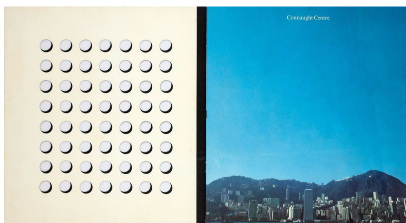
【香港置地，康樂大廈宣傳冊 1973】

他常常運用符號為企業設計出眾的作品，尤其在上世紀 60 至 90 年代，香港經濟由製造業轉型為金融中心，石漢瑞先生為不少企業塑造現代化和國際化的形象。